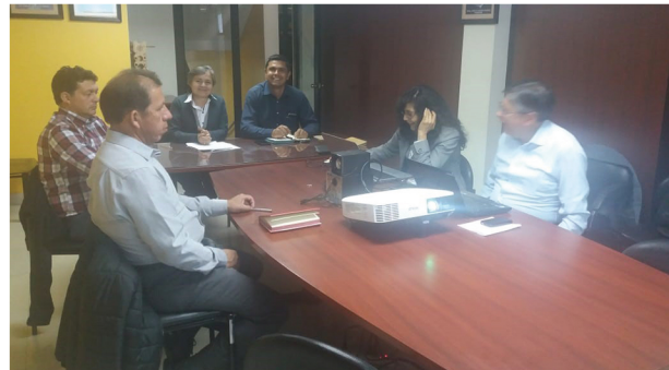
Comité de Gobernanza

El impacto del acompañamiento GIF ha sido positivo porque ratificó que las iniciativas de aplicar buenas prácticas fueron acertadas, y durante esos 12 meses de trabajo lo que se ha logrado es fortalecer los conocimientos y promover mayor compromiso en cada miembro del Directorio y del personal de la cooperativa. La mejora continua es parte de la esencia de fortalecimiento y estandarización de la Cooperativa San Antonio.