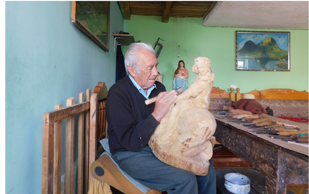
Prestatario San Antonio