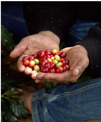
Producción de Café, una de las principales actividades de los beneficiarios de NORANDINO