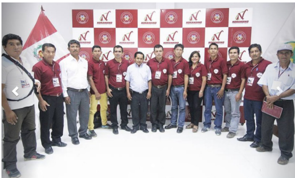
Gerencia, Administradores, Directivos y Jefes de Área de NORANDINO (Taller sobre relacionamiento con Grupos de interés (Octubre, 2017)

Se advierte el compromiso de seguir trabajando en el Plan de Mejora que se desarrolló con el Proyecto GIF, a pesar que el acompañamiento como tal haya acabado, Norandino dentro de su Plan de Crecimiento ha considerado contratar en el transcurso del año a un profesional encargado del área de procesos y métodos que se dedique a desarrollar la actualización de manuales y reglamentos.