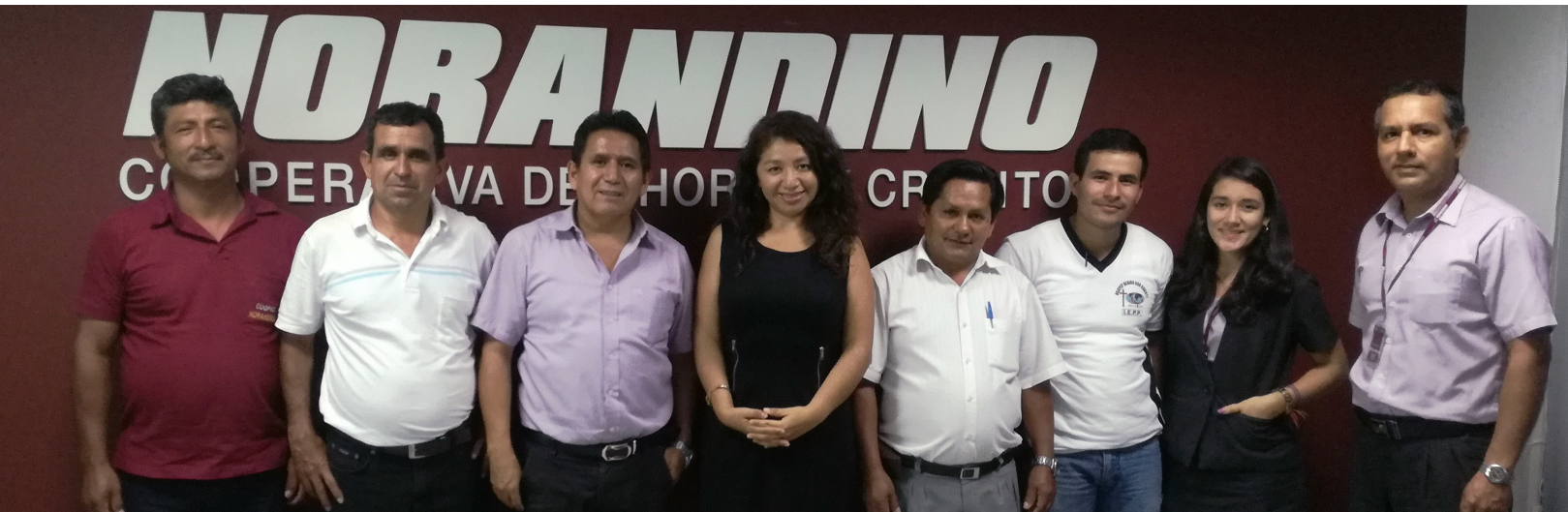
Directivos, Gerencia y Consultora Capacitadora de NORANDINO, Presentación de Diagnóstico Ex Post Proyecto GIF (Enero, 2018)

El Comité de Gobernanza debe ser institucionalizado, es la instancia permanente que promueve la implementación de las buenas prácticas de Gobernanza. Dicha institucionalización permitirá dar sostenibilidad a esas buenas prácticas que el Proyecto GIF fomenta.