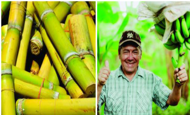
Actividades productivas de los beneficiarios de NORANDINO