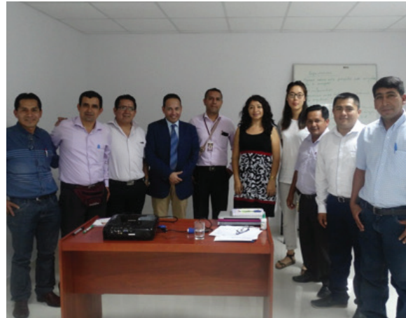
Sesión inicial (Junio, 2016) Directivos, Gerencia, y Consultora Capacitadora de NORANDINO, y Director Proyecto GIF

Al iniciar el proceso de acompañamiento GIF, el Diagnóstico permitió no solo visualizar las fortalezas institucionales sino también las áreas de mejora; una de estas áreas fue la carencia de políticas claras, lo que condujo a redefinir las reglas y las políticas, así como adecuarlas a las capacidades de cada departamento de la institución y fundamentalmente precisar mejor sus responsabilidades para tener control y seguimiento que asegure la sostenibilidad de la entidad.