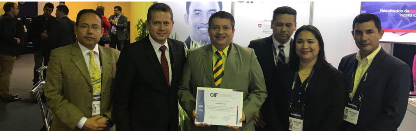
Entrega del Certificado de Mejora de la Calidad de Gobernanza (Buenos Aires, octubre de 2017)