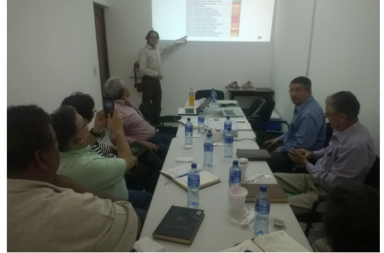
Equipo de trabajo FUNDENUSE

Como parte del uso de la herramienta, FUNDENUSE emprendió un proceso de mejora que involucró a distintas instancias dentro de la institución, entre ellas su equipo ejecutivo, Comité de Gobernanza y el consultor capacitador. En el proceso se trabajó de manera integral 34 estándares, lo cual permitió obtener una mejora de 39% en la calidad de su gobernanza (65 puntos porcentuales de mejora asociado a la dimensión formal y 16 puntos en la dimensión factual).