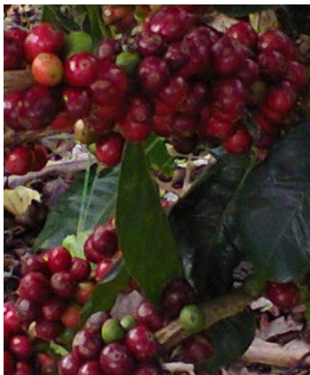
Actividad productiva de clientes de FUNDENUSE