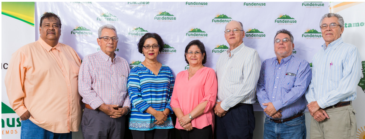
Junta Directiva y Comité de Gobernanza de FUNDENUSE

El Comité de Gobernanza lideró el proceso de implementación de buenas prácticas, así se escribieron procedimientos para el manejo de conflictos de interés y la interrelación de los órganos de dirección basados en estándares de calidad de gobernanza, para lograr ser sostenibles en el tiempo e impulsar la inclusión financiera.