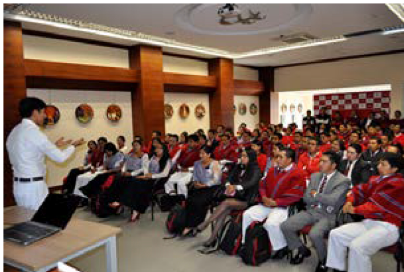
Sesión inicial del acompañamiento GIF

La herramienta en sí no genera inclusión financiera, sino que permite a la institución generar procesos de monitoreo, y en función a los datos que se rescatan, se tomarán decisiones de inclusión financiera y se diseñarán políticas para fortalecerla.