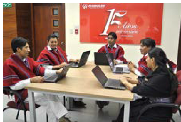
Comité de Gobernanza de Chibuleo