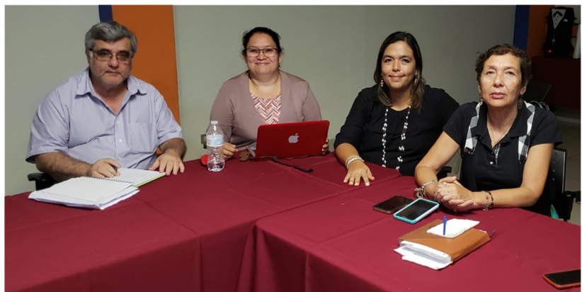
Junta Directiva CrediManá