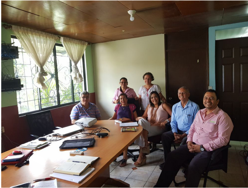
Comité de Gobernanza de CrediManá