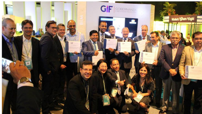
Entrega del Certificado de Mejora de la Calidad de Gobernanza en FOROMIC (Barranquilla, octubre de 2018)

El proceso de acompañamiento GIF ha dejado una tarea importante en cuanto a continuar fortaleciendo la dimensión de control de su gobernanza. Está claro que esta dimensión de la gobernanza es crítica para la sobrevivencia de la entidad en el largo plazo. Por ello, se ha identificado con claridad la necesidad de fortalecer los sistemas, manuales y procedimientos de control interno y gestión de riesgos, con el trabajo coordinado en los comités de auditoría y riesgos. Aunque CrediManá es una entidad pequeña se ha aprendido a valorar la importancia de estos sistemas.