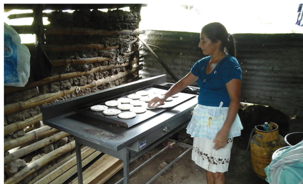
Prestataria de CrediManá - Tortillería

Las principales actividades económicas de sus prestatarias, que en su mayoría son mujeres de áreas rurales son: