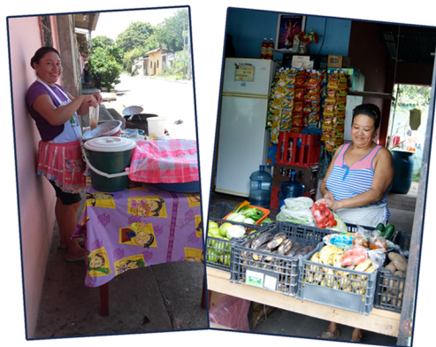
Prestatarias de CrediManá

En la etapa anterior al proceso de acompañamiento GIF, el tema de la sucesión de cargos críticos había sido un tema muy poco discutido, aunque se encontraba en el centro de las preocupaciones institucionales. A través del proceso con el Proyecto GIF se ha aprendido la importancia de planificar cuidadosamente el proceso de sucesión, tanto en los cargos de la Dirección Ejecutiva como de los otros cargos directivos. Ahora está claro que esta temática debe ser explícita, planificada y ampliamente discutida por todos los directivos de la institución.