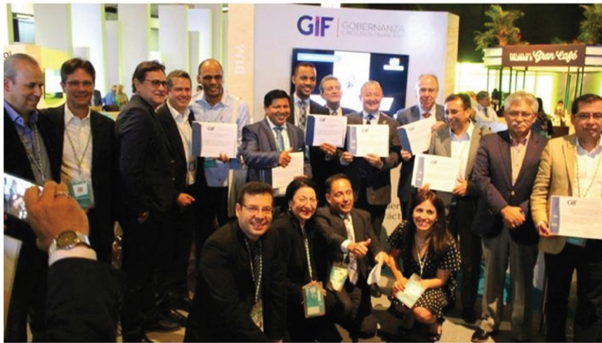
Entrega del Certificado de Mejora de la Calidad de Gobernanza en FOROMIC (Barranquilla, octubre de 2017)