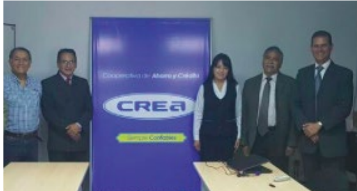
Comité de Gobernanza y Junta Directiva CREA