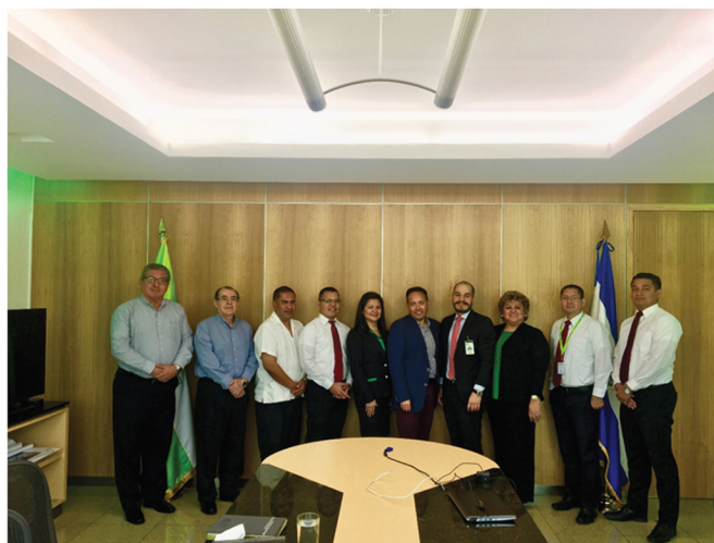
Sesión evaluatoria con el proyecto GIF