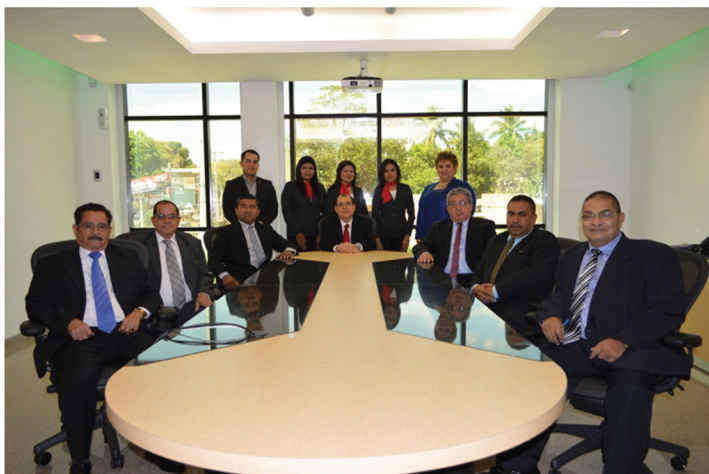
Comité de Gobernanza y Equipo Gerencial de CCSV