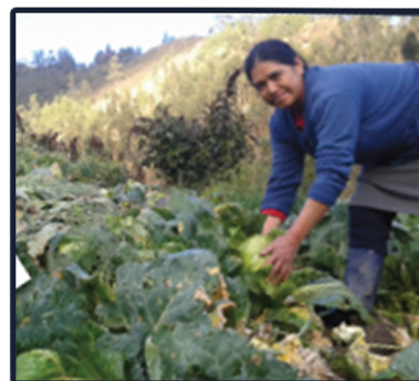
Actividad productiva de beneficiaria de FACES

•Pecuarías: cría y reproducción de ganado, crianza pollos, cría y reproducción de cerdos.