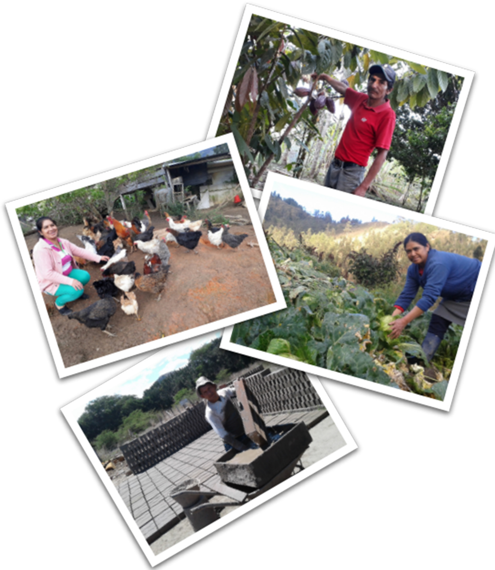
Actividades productivas de prestatarios