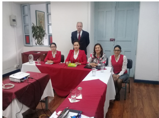
Comité de Gobernanza de FACES