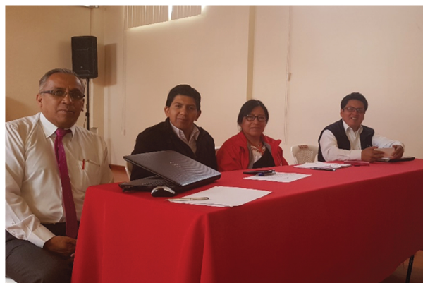
Comité de Gobernanza - COAC Daquilema

La COAC Daquilema ha incorporado como parte del proceso de planificación estratégica indicadores relacionados con los grupos de interés de la cooperativa y sus necesidades, asimismo ha incluido la medición de indicadores sociales alineados a la misión institucional, y ha implementado acciones de cumplimiento a los principios de protección al cliente.