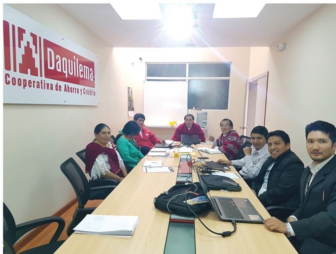
Consejo de Administración y parte del equipo COAC Daquilema