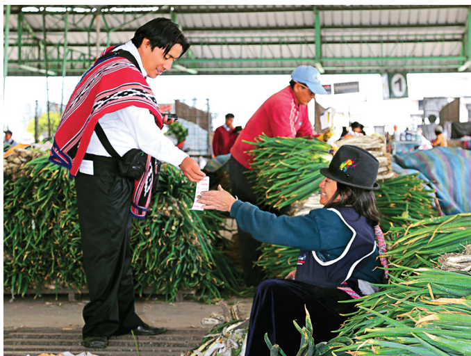
Clienta COAC Daquilema