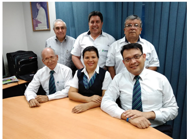
Comité de Gobernanza COOTECU