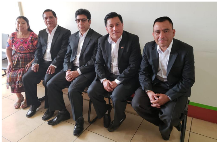
Consejo de Administración CREDIGUATE

En el proceso de fortalecimiento del Proyecto GIF se reflexiona este hecho y se toma el reto de afrontar la inclusión financiera de sectores excluidos en el área de su influencia, mediante la innovación de metodologías y el diseño de nuevos productos que permitan el acceso al sistema financiero, así el buen gobierno de la cooperativa sirva para incluir a los segmentos poblaciones aun no atendidas.