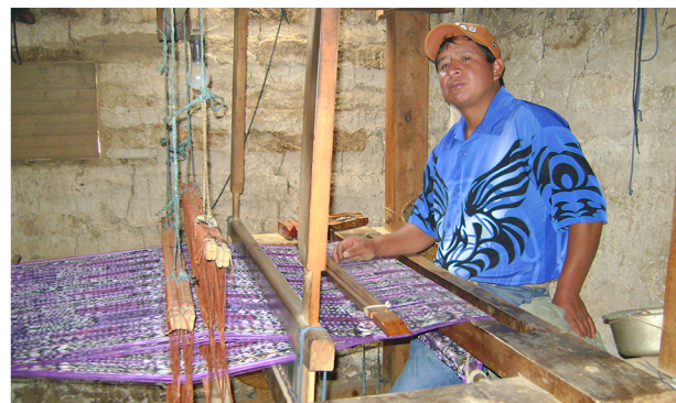
Prestatario de CREDIGUATE elaborando canastas de plástico

En el proceso de mejora de la gobernanza e inclusión financiera en CREDIGUATE se trabajó de manera integral con 37 estándares establecidos por el Proyecto GIF, en los cuales se alcanzó una mejora del 34,6% en la calidad de su gobernanza (67 puntos porcentuales de mejora asociado a la dimensión formal y 11 puntos porcentuales en la dimensión factual).