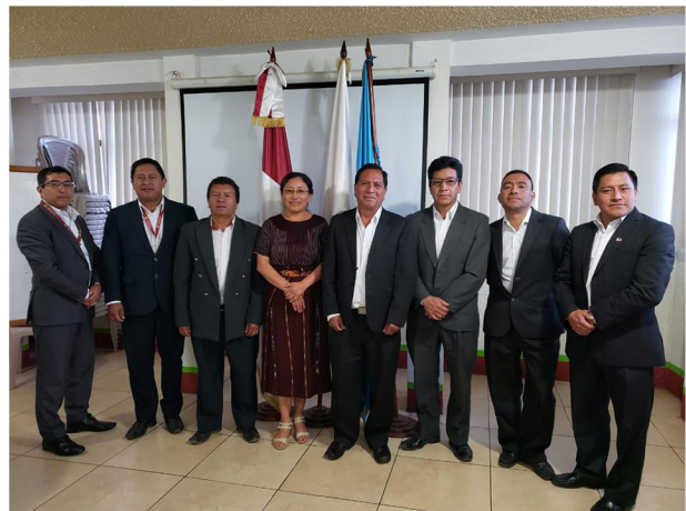
Comité de Gobernanza CREDIGUATE