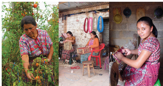
Prestatarias de CREDIGUATE

Los servicios que CREDIGUATE ofrece a sus clientes son: