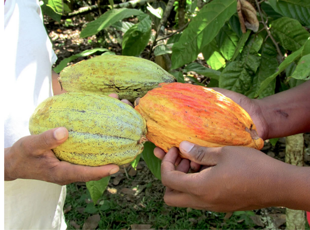
Producción del Cacao apoyada por COOPNACADO

COOPNACADO es una cooperativa que reúne productores cuyo centro de actividad se encuentra en la explotación, procesamiento y comercialización de cacao para lograr exportar y promover ese producto dominicano a nivel mundial, cuenta con sucursales en diversas zonas y entornos del país.