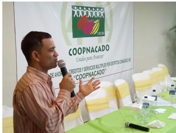
Gerente General explicando en una Asamblea el alcance del Proyecto GIF

Es de resaltar la importancia del Comité de Gobernanza y de los órganos de dirección para garantizar la implementación y la puesta en marcha del nuevo diseño de gobernanza recién aprobado, así como la continuidad en la adopción de los demás estándares y componentes relevantes a la misión y visión de la cooperativa. Un año de diagnóstico y acompañamiento permite cimentar una buena base, la cual debe continuar siendo alimentada y reforzada en el tiempo, a fin de que los frutos de la buena gobernanza permanezcan y se fortalezcan. La mejora de la gobernanza es un proceso estratégico continuo para las instituciones que se proponen permanecer y trascender.