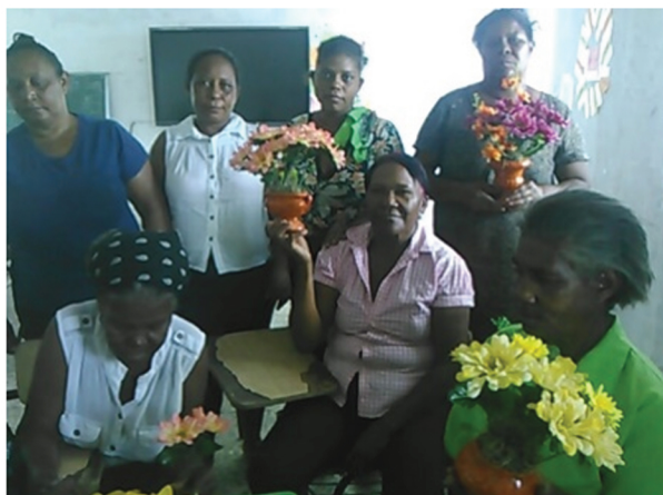
Prestatarios de COOPFEPROCA

Los servicios que ofrece a sus socios y prestatarios son: