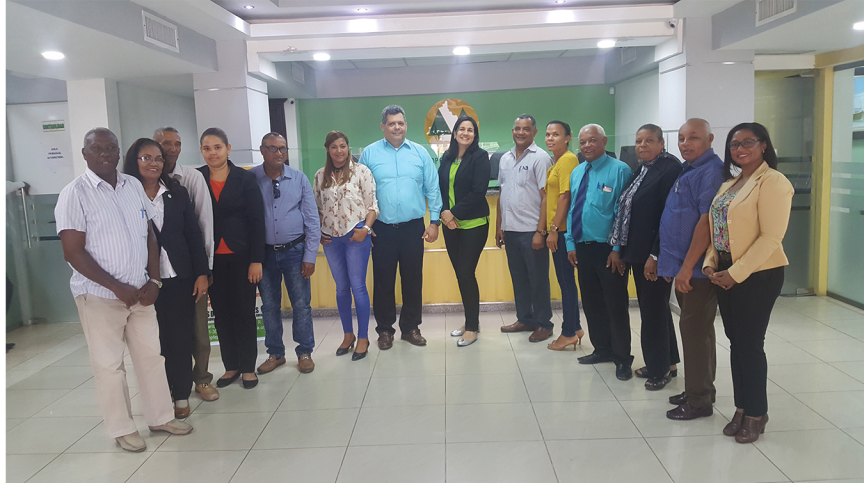
Consejo Ampliado de COOPFEPROCA

Se entendió la necesidad de formalizar la evaluación de los órganos de dirección. Se pautó que los órganos de dirección y cada uno de sus miembros serán evaluados, por lo menos una vez al año con relación a sus deberes y funciones. El Comité de Gobernanza será responsable de coordinar dicha evaluación a cada uno de los organismos. Los resultados obtenidos de las evaluaciones serán reportados al Consejo Ampliado.