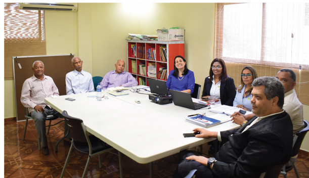
Comité de Gobernanza COOPFEPROCA

Las herramientas GIF han ayudado con temas de innovación en sus procesos, en un principio se dieron cuenta de que tenían muchas debilidades y en virtud al plan estratégico crearon el Comité de Gobernanza incluyendo personal vinculado con operaciones, auditoría interna, tecnología y al Asesor Financiero, entre otros, llegando a completar un comité compuesto por 11 personas. Pese a que este número alto puede generar el riesgo de frenar el proceso por falta de coordinación, se ha podido constatar que al contrario han trabajado muy bien en equipo. Destacan también que a través de la gobernanza pueden enfrentar mejor a la competencia.