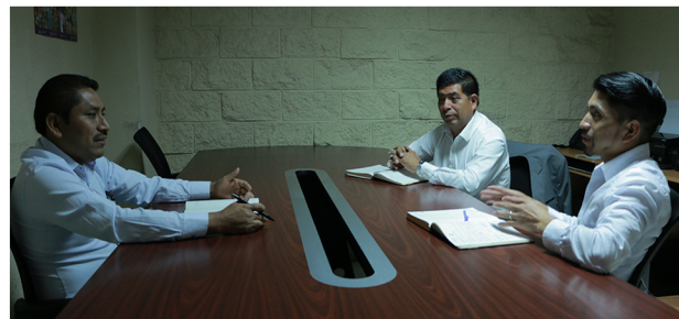
Comité de Gobernanza ADISA