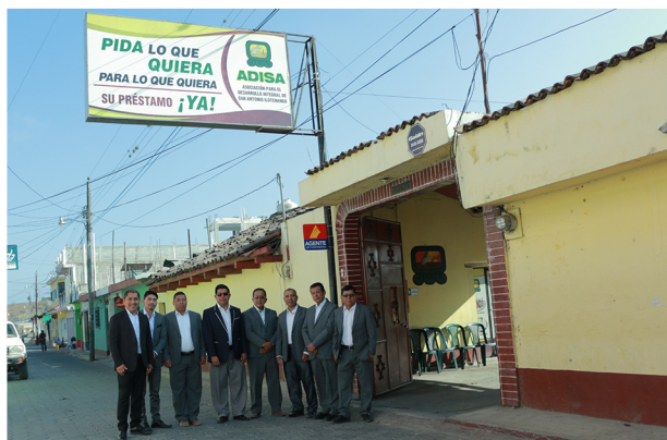
Junta Directiva ADISA

El aprendizaje de la importancia del Código de Ética y la aplicación práctica del mismo en los diferentes niveles de la organización, a través de la capacitación a los empleados y los asociados es fundamental. El Código de Ética debe constituirse en una herramienta para el buen gobierno de la organización y las personas que son parte de la institución.