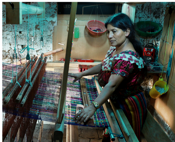
Prestataria de ADISA

Los servicios que ADISA ofrece son los siguientes: